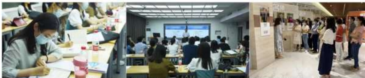
华中师范大学第一附属中学--教研助力教师成长

型错误，对自己分配的课时制定翔实具体的教学目标，思考对应的评价活动。在集体备课时，备课组成员轮流展示自己的教研成果，并进行讨论，优化教学目标和评价活动。