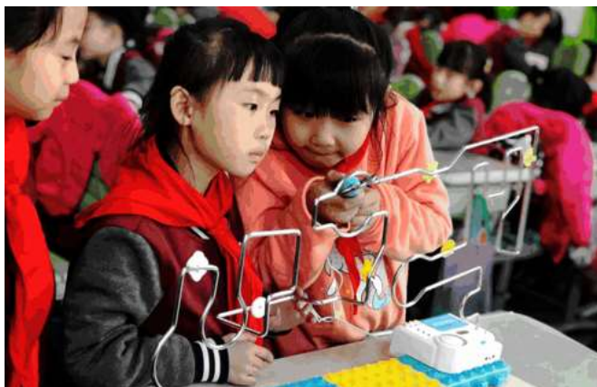
辽宁本溪市实验小学

以小组合作探究为例，教师从“改进课堂生态、变革课堂模式、研究课堂实践”的视角，总结课堂增效的途径和方法，形成小组合作学习“五步法”。此外，学校采取赋能管理、赋能智慧等六大行动激活内部活力，提升教师专业素养，赋能教师成长；精准把握教学的深度和广度，对不同学力的学生采取分层教学的方式，因材施教。