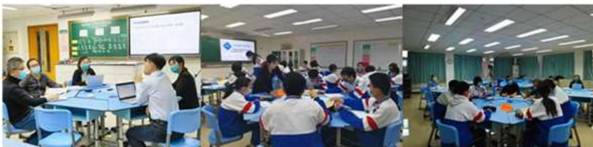
北京景山学校攀峰课堂